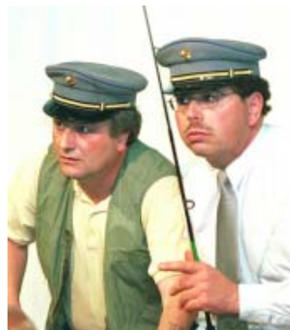
Deux Ouvre-boîtes dans Déravage incontrôlé de J.-M. Gavin (2000)

Le public ne s'y trompe pas et c'est cette atmosphère unique et ce « je ne sais quoi de bonne humeur et d'auto-dérision » comme dit le président, qui a séduit les Transports Lausannois (TL), les Dicodeurs de la Radio Suisse Romande et plusieurs sociétés locales qui ont invité L'Ouvre-boîte à Forel, Mézières, Morrens, Prilly ou Pully au cours de ces vingt ans. L'un des palaces de Lausanne charge même la société d'organiser un dîner-spectacle. « On était