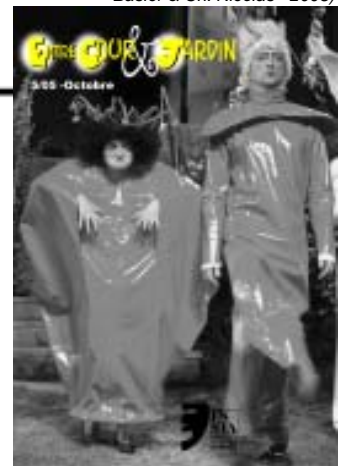
Photo de la 1ère page: Alice au Pays des Merveilles d'après Lewis Carroll, par la troupe de Serreaux- Dessus à Begnins/VD (mise en scène: J. Basler & Ch. Nicolas - 2005)

En résumé, votre allumée attirée vous le dit: mélangez-vous!