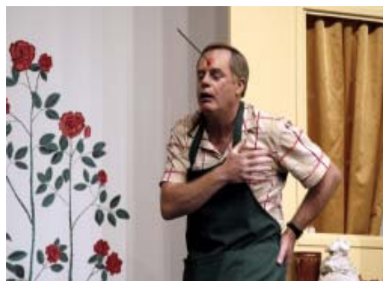
Les comédiens du Creux du Niton dans 22, rue Babole de Christiane Favre-Artéro (2004)